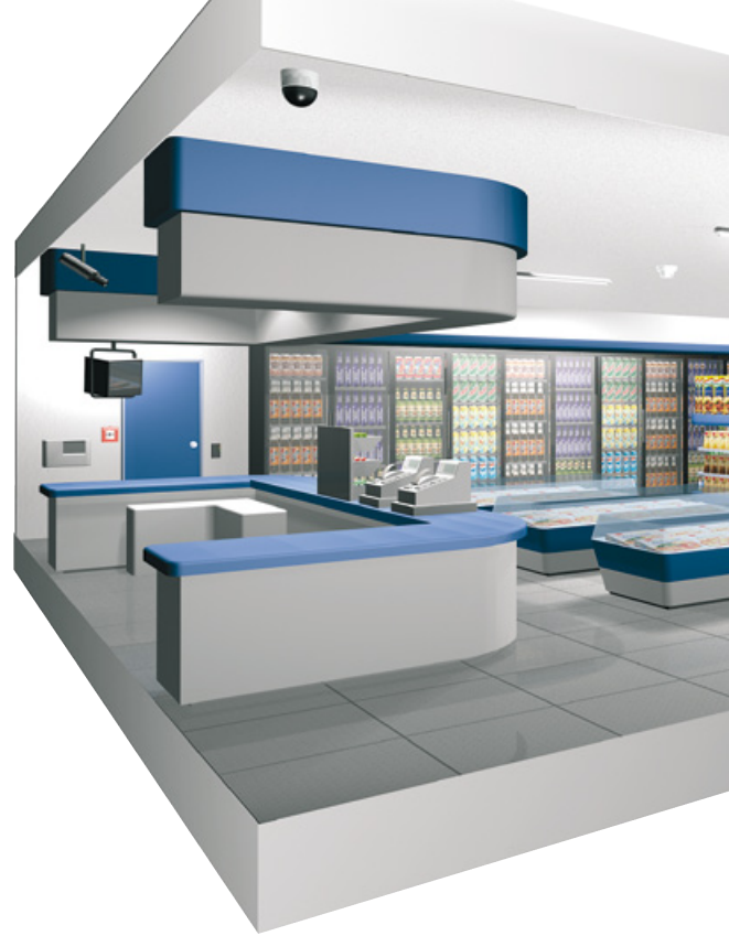
Maßgeschneidert für Haus, Gewerbe, Industrie